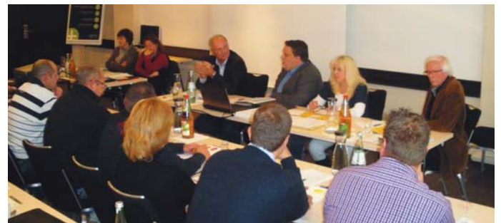
> Die Bezirksleitung.

Dann ging Beisch auf die erzielten Erfolge bei der Polizeizulage und der Wiedergewährung der Sonderzahlung ein. Bereits im vergangenen Jahr gab es einen Erlassentwurf des BMF, wonach die Polizeizulage ab September 2010 den Kolleginnen und Kollegen in der Warenabfertigung bei Grenzzollämtern gestrichen